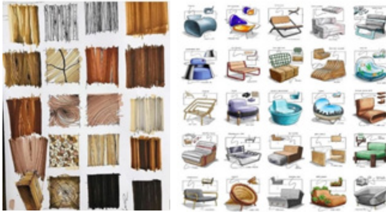
Hình 1. Diễn họa vật liệu và đồ nội thất