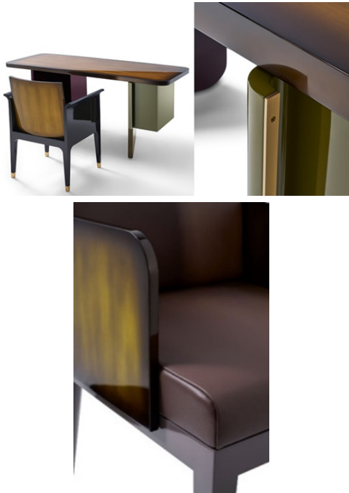
Hình 5. Chiếc bàn Comfy và ghế Gingery Bộ của Hanoia

Kỹ thuật cần veneer hình dễ quạt trong thiết kế đồ nội thất sơn mài của Hanoia phá vỡ sự đơn điệu của sơn mài và tạo nên những chi tiết bất ngờ thú vị. Họa tiết xuất hiện trên chiếc bàn Savoury là hơi thở của tự do sáng tạo kết hợp với tính tỉ mỉ trong chế tác của nhà thiết kế tài hoa Richard Le Sand và các nghệ nhân sơn mài Hanoia. Mặt bàn cần veneer, để có thể kết nối thành một mảng đều khít, các miếng cắt cần bằng nhau, bởi mọi thừa, thiếu đều dẫn đến việc phải phá bỏ và làm lại từ đầu.