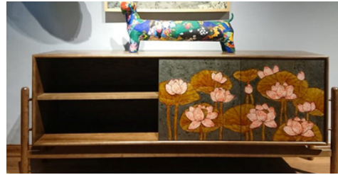
Hình 8. Bộ tủ kệ sơn mài hoa sen