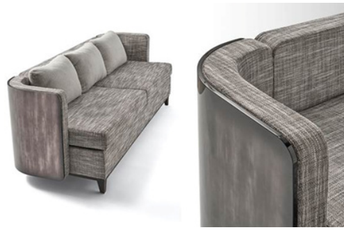
Hình 6. Ghế sofa nỉ kết hợp chất liệu sơn mài của Hanoia

Việc chế tác đồ nội thất sơn mài hiện đại ngày nay vô cùng phức tạp, bởi cần sự kết hợp và chính xác của nhiều công đoạn. Ví dụ: với chiếc ghế sofa, để phần ốp sơn mài ôm lấy đường cong thành ghế, các kết cấu khác của ghế phải chính xác đến từng mi-li-mét.