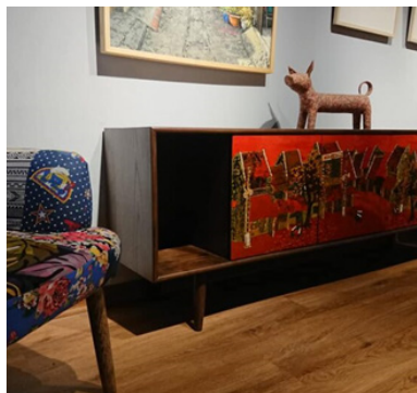
Hình 9. Bộ tủ kệ sơn mài phố cổ

Nguồn: https://indochinehouses.vn/san-pham/tu-ke-son-mai