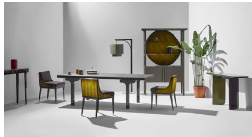
Hình 7. Bộ bàn ghế phòng khách của Hanoia