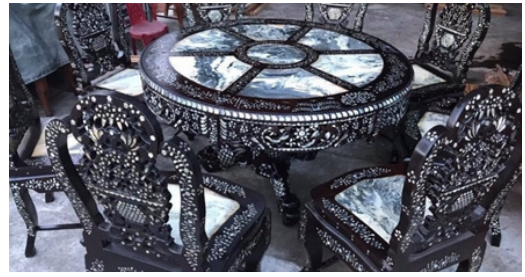
Hình 4. Bộ bàn ghế khảm trai