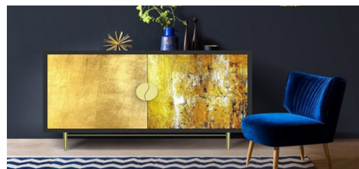
Hình 12. Bộ tủ kệ sơn mài phòng khách

Nguồn: https://bpurehome.com/products/tu-son-mai-peafowl-693.html