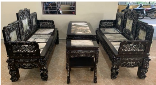
Hình 2. Bộ bàn ghế phòng khách khảm trai