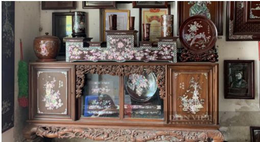
Hình 1. Bộ tủ chè gỗ khảm trai

gian khác nhau, được thiết kế dùng để ngồi uống nước tiếp khách, nằm ngủ, nghỉ ngơi như một chiếc giường. Tủ chè là sản phẩm được dùng bày đồ trang trí. Đây là mẫu tủ bày đồ phù hợp dùng để trang trí trong những không gian phòng cách cổ như ngôi nhà ngói 3 gian hoặc 5 gian là phù hợp nhất. Và thông thường, được trang trí kèm với những bộ sập gụ hoặc trường kỷ.