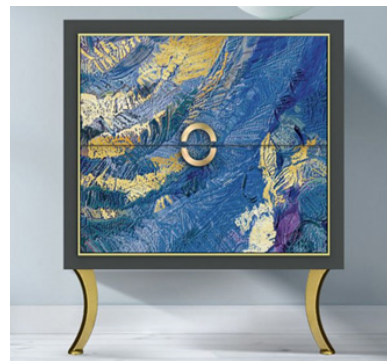
Hình 10. Bộ tập tủ sơn mài phòng khách