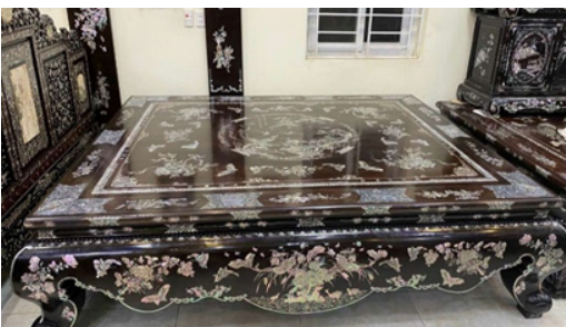
Hình 3. Bộ sập khảm trai