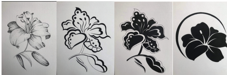
Hình 2. Bài nghiên cứu, ghi chép và cách điệu hoa lá của SV. Ngô Quốc Khánh - Khoa MTCN&KT, Trường Đại học Hòa Bình

Cách điệu hoa lá là quá trình đơn giản và lược bỏ đi những chi tiết không cần thiết, rườm rà để giữ lại những nét đẹp điển hình của loại hoa lá đó, giúp cho chúng đẹp thêm, có giá trị hơn. Nghĩa là phân nào biết nâng những hình vẽ hoa lá từ tự nhiên lên một bước, tiến dần đến trang trí cách điệu.