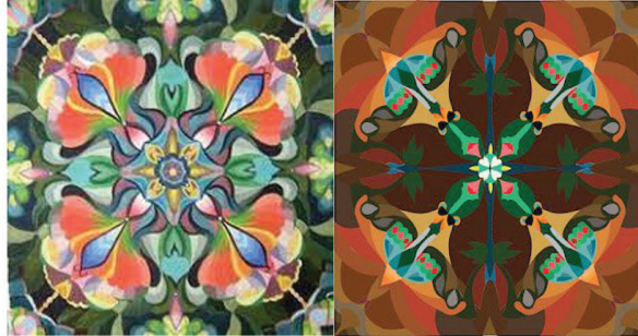
Hình 8. Sử dụng họa tiết hoa lá đã cách điệu trong trang trí hình vuông

khắc laser... Những công nghệ tiên tiến này có thể tạo ra những họa tiết đẹp rực rỡ và lặp lại giống hệt nhau trên những sản phẩm công nghiệp được sản xuất hàng loạt, chín chu hơn.