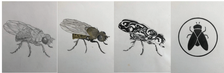
Hình 4. Bài nghiên cứu, cách điệu côn trùng của SV. Vương Thị Hải Yến - Khoa MTCN&KT, Trường Đại học Hòa Bình

Cách điệu theo cấu trúc: do yêu cầu phải có một loại mô típ hết sức cô đọng, giản đơn, có tính tượng trưng cao thì phải theo cách điệu lối này. Ví dụ: tộc huy, gia huy, quốc huy, biểu trưng của các hãng... Cũng có thể đó là những mô đun trang trí kiến trúc, gạch thông gió, chạm khắc đá, kim loại. Thực ra, giữa hai hình thức này không có ranh giới tuyệt đối mà trong nhiều tác phẩm, nhiều mô típ trang trí vẫn có sự giao thoa để phù hợp với những cung bậc khác nhau giữa cấu trúc và tự nhiên, giữa cảm xúc và trí tuệ.