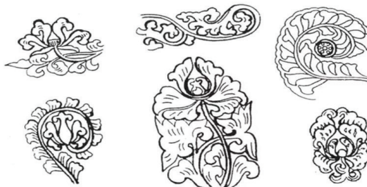
Hình 1. Hoa cúc cách điệu với nhiều thể dáng khác nhau

Cách điệu là một hình thức khái quát hoá quan trọng trong nghệ thuật. Cách điệu tiếng Anh là Stylized, có nghĩa là, bằng cách biểu đạt đơn giản, nhấn mạnh ý chính cần nêu, phát hiện yếu tố đẹp của đối tượng đó, và có thể đem nó dùng làm mô típ trang trí. Khái quát hóa không chỉ là lược bỏ những chi tiết của một hình vẽ mà nó là một công việc rất phức tạp, tinh vi, điêu luyện, là việc tinh lọc để giữ lại những hình thiết yếu, diễn tả cái cốt lõi của sự vật.