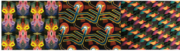
Hình 5. Một số bộ cục ứng dụng họa tiết cách điệu động vật của SV. Trường Đại học Hòa Bình

điểm nhấn, phong cách nghệ thuật riêng. Hoa văn của vải bọc hoặc giấy dán tường được cách điệu từ các chi tiết thiên nhiên hay từ các đường cong lá lướt, cho ta liên tưởng đến các đường nét tranh trừu tượng. Các đường nét trang trí tạo nên các chi tiết