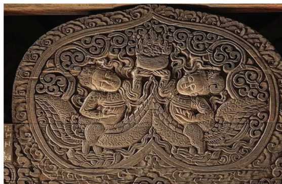
Hình 7. Cách điệu hoa lá và hình người trong bức chạm Tiên nữ dâng hoa (Chùa Thái Lạc, Hưng Yên, thế kỷ XVI)

ứng dụng ngày càng chuyên nghiệp hơn. Ở các thành phố lớn, nhiều công ty nước ngoài phát triển chuyên về lĩnh vực này. Cùng với quá trình đô thị hóa diễn ra mạnh mẽ, cơ sở vật chất ngày càng được nâng cấp, yêu cầu của khách hàng trong và ngoài nước cũng trở nên khắt khe.