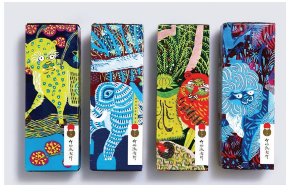
Hình 9. Ứng dụng những họa tiết hoa lá, động vật trên bao bì sản phẩm