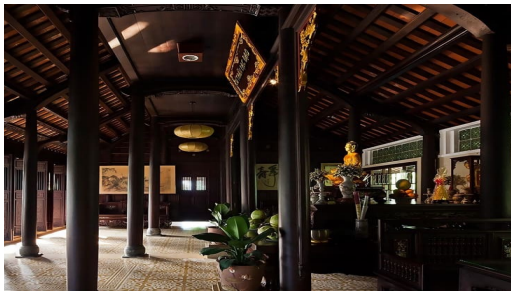
Nội thất truyền thống Việt Nam [3]

ơ chế thị trường, do vậy, việc phát triển ngành thiết kế và tư vấn thiết kế sẽ giúp nhà thiết kế và người sử dụng khắc phục vấn đề này. Kéo theo sự phát triển của ngành thiết kế trang trí nội thất, việc đào tạo trang trí nội ngoại thất đang phát triển rất nhanh để đáp ứng nhu cầu thiết kế và tư vấn trang trí nội ngoại thất công trình của xã hội. Tuy nhiên, nếu không có sự đầu tư xây dựng chương trình giảng dạy tiên tiến, có hệ thống, đội ngũ giáo viên chuẩn mực với đầy đủ kiến thức và bản lĩnh nghề nghiệp, đồng thời, định hướng chiến lược phát triển lâu dài thì chất lượng đào tạo sẽ không cao, không thể đào tạo được những nhà thiết kế giỏi đủ sức hình thành phong cách tiêu biểu, thể hiện bản sắc kiến trúc dân tộc Việt Nam, và đáp ứng kịp nhu cầu ngày càng nhiều của xã hội, cũng như sự phát triển, lớn mạnh cho ngành thiết kế trang trí nội ngoại thất Việt Nam.