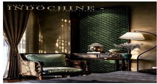
Villa Ba Son - Sài Gòn, Thiết kế của Công ty TNHH Design và Build Kiến Phong

Ngày nay, cách nhìn về truyền thống dân tộc của người thiết kế và cả người sử dụng ngày càng có chiều sâu hơn, không đơn thuần chỉ là những mô típ hay hình thức bề ngoài. Quá trình giao lưu kiến trúc và nghệ thuật trên thế giới thường bắt đầu là sự phản ứng, xung đột trước các hình thức mới lạ, sau đó là quá trình đối thoại, tìm hiểu, để rồi tiếp nhận và thử nghiệm, tiếp theo là sáng tạo và phát triển. Chỉ đến khi có sự hoán cải, tiếp biến cả nội dung lẫn hình thức giữa truyền thống và tiếp thu những cái mới thì mới thể hiện được tinh thần dân tộc, nâng nó lên tầng cao mới thì mới hòa nhập được với thế giới. Phát triển và kế thừa trên cơ sở vừa hiện đại vừa dân tộc cũng là một xu hướng lớn để phù hợp với hoàn cảnh và cuộc sống hiện đại. Bởi vì, bản sắc dân tộc luôn luôn có nhu cầu tiếp nhận và vận động để phát triển.