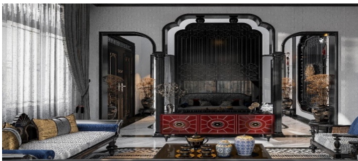
Nội thất phòng khách tại Timeless Villa Quận 2 Thiết kế của Công ty TNHH Design và Build Kiến Phong

Những hình thức biểu hiện trong trang trí không gian nội thất vẫn dựa trên một số hình thức đã hình thành từ trước đến nay, đó là, nệ cổ, giả cổ, ngoại lai hoặc kế thừa và chọn lọc những đặc tính văn hóa truyền thống, kế thừa và phát triển trên cơ sở hiện đại và kết hợp với bản sắc dân tộc.